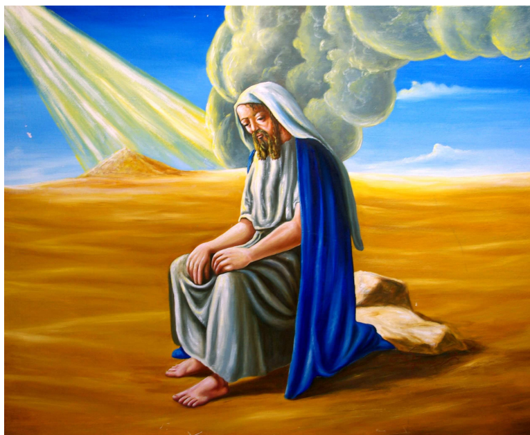
Gesù nel deserto. Olio di Carlo Baglione

Gesù nel deserto. Ascoltiamo il silenzio